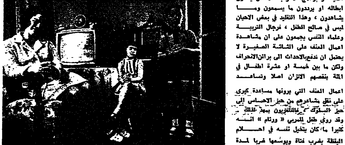
المهارات الأخرى . كما ان الكثير من الاختصاصيين والمربين يوصون بالحد من برامج على التلفزيون لما فيه من مائدة .

التلفزيون وسيلة اعلام وتثقيف لها اثر كبير في نفوس المشاهدين سواء اكانوا صفارا او كبارا .. وفي الاونة الاخيرة انتشر التلفزيون انتشارا واسعا في ارجاء متعددة من انحاء العالم واخذ يتبع الناس بشهادة برامج مختلفة وتلك البرامج من هذه البرامج تثير انتباهنا ونحن بالتبعية للمشاهد فانت انتباهنا مثلا ان اطفالك في مزج ومرج ولكن سرعان ما نجدهم قد هدأوا وكان على رؤوسهم الطير كالم عيون على الشاشة الصغيرة يتابعون باهتمام ما تظهر امامهم من الصور المتحركة التي تسويهم ويحسون معها لا يفتأ به خيال الطفل من خصم عظيم ، ان تلاحظ ان اطفالك يتصورون صورهم في خيالهم مثلا يعني ظهر الكرمي ويحاول ان يقد بها طائرة شاهدها في التلفزيون ويكون هو رباتها كما يتصور نفسه . وهو يحاول التقليد فيركب الاكبات ، فما من اغنية او برنامج الا توجد الاطفال يقدون ابطاله او يرددون ما يسمعون وما يشاهدون ، وهذا التقليد في بعض الاحيان ليس في صالح الطفل ، فزجال التربية وعلمها التي يجمعون على ان مشاهدة افعال العنف على الشاشة الصغيرة لا يحسن ان تدفع بالاحداث الى برائن الاحراف ولكن ما بين خمسة او عشرة اطفال في اقله يتفهم الاثران اصلا وتساعده